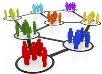
Схема взаимодействия сторон проекта ГЧП в постинвестиционный период